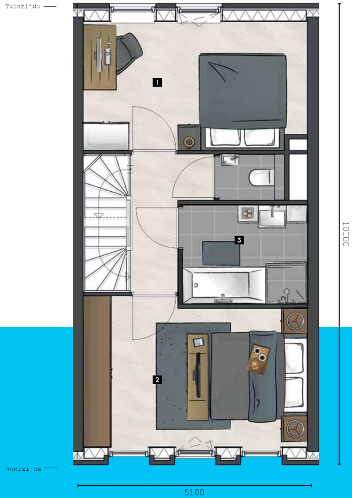
TWEDE VERDIEPING Schaal 1:50