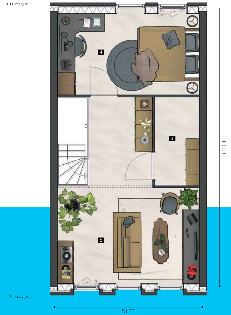
DERDE VERDIEPING Schaal 1:50