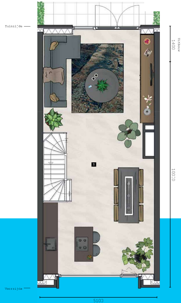
BEGANE GROND Schaal 1:50