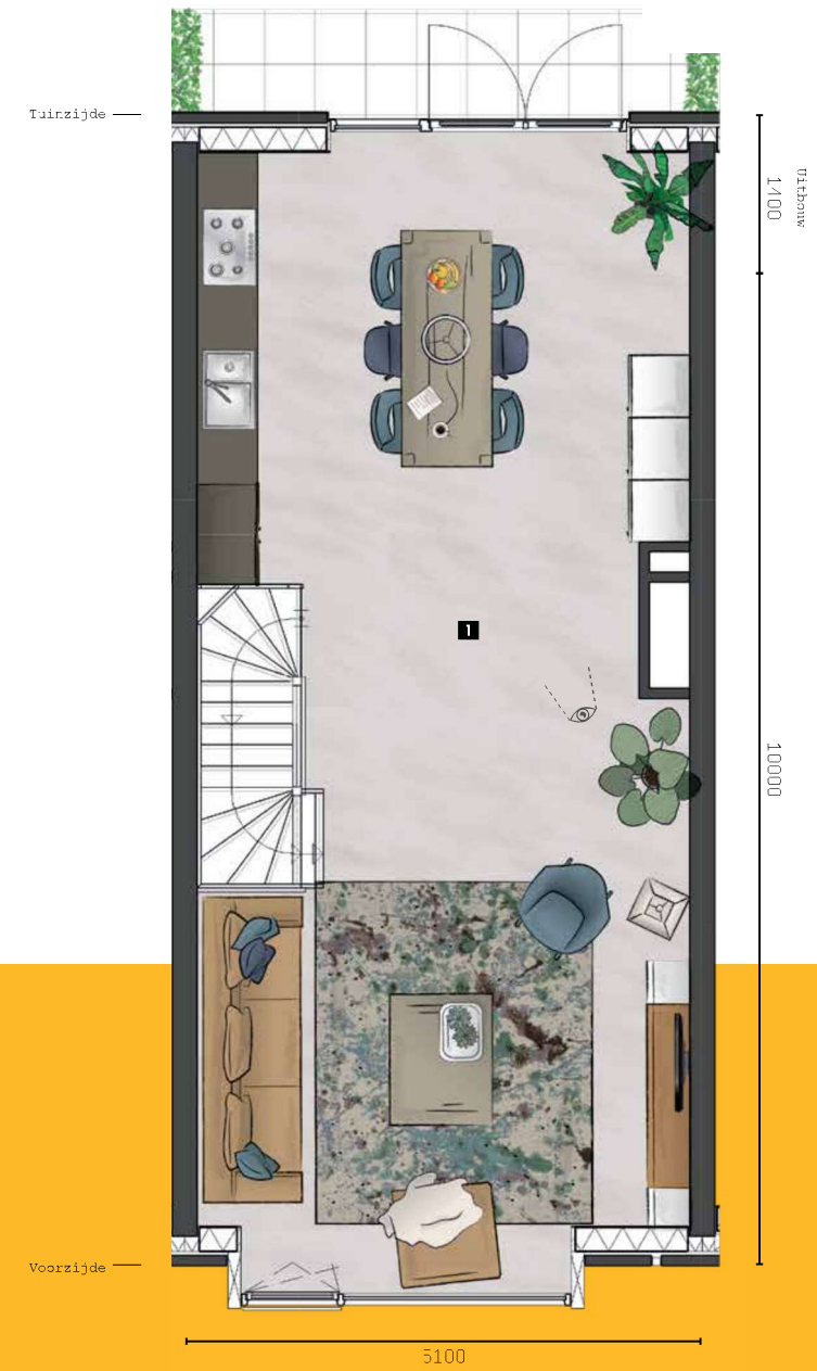
BEGANE GROND Schaal 1:50